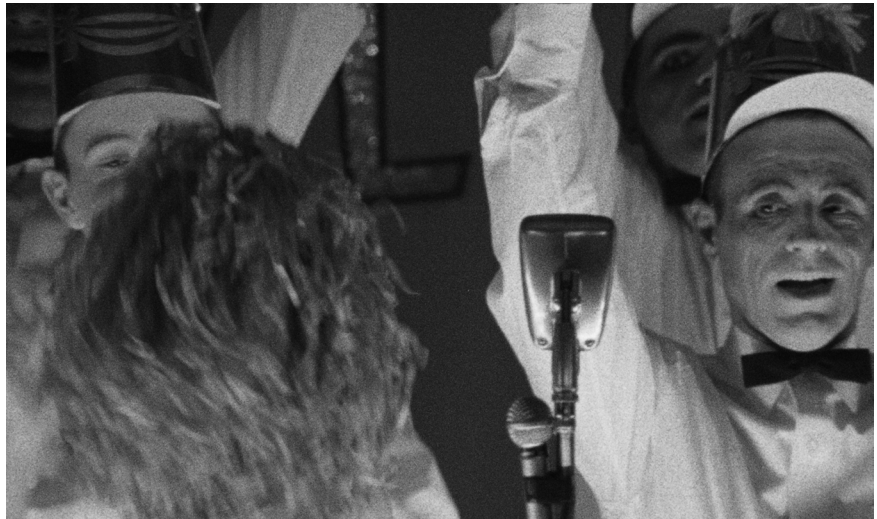
Titicut Follies (1969)

Dès Titicut Follies , Frederick Wiseman choisit la position de preneur de son au tournage, immuable depuis. Cela le rend évidemment actif lors des tournages très intenses, mais aussi en quelque sorte spectateur et témoin des scènes, moins "aveugle" en tout cas qu'un opérateur de prise de vues. Il est aussi, dès Titicut Follies , le monteur de ses films, ce qu'il n'a jamais cessé d'être, une activité qu'il n'envisage qu'en solitaire. Il s'agit de l'étape décisive de mise en forme, structuration du film à partir de l'importante matière accumulée au tournage.