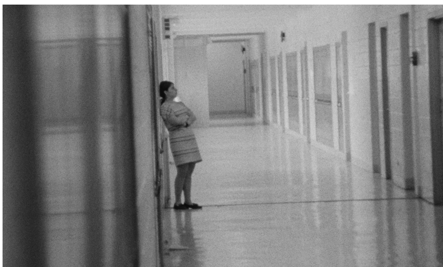
High School (1968)

Dès 1971 afin de se garantir une indépendance de création, il crée sa propre société de production et de distribution Zipporah Films.