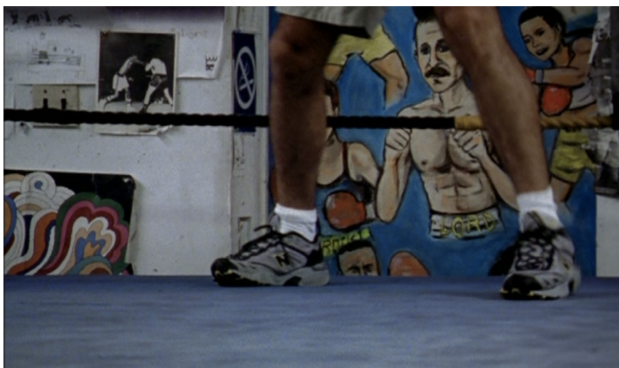
Boxing Gym (2010)

Boxing Gym (2010, couleur, 1 h 31 min) / National Gallery (2014, couleur, 2 h 54 min) / Menus-Plaisirs - Les Troisgros (2023, couleur, 4 h)