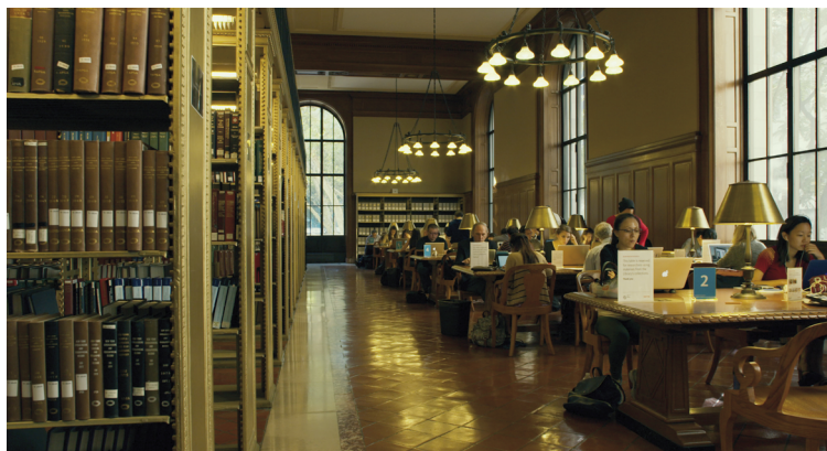
Ex Libris : New York Public Library (2017)

High School (1968, noir et blanc, 1 h 15 min, VR4K) / High School II (1994, couleur, 3 h 40 min, VR4K) / At Berkeley (2013, couleur, 4 h 04 min) / Ex Libris : The New York Public Library (2017, couleur, 3 h 17 min)