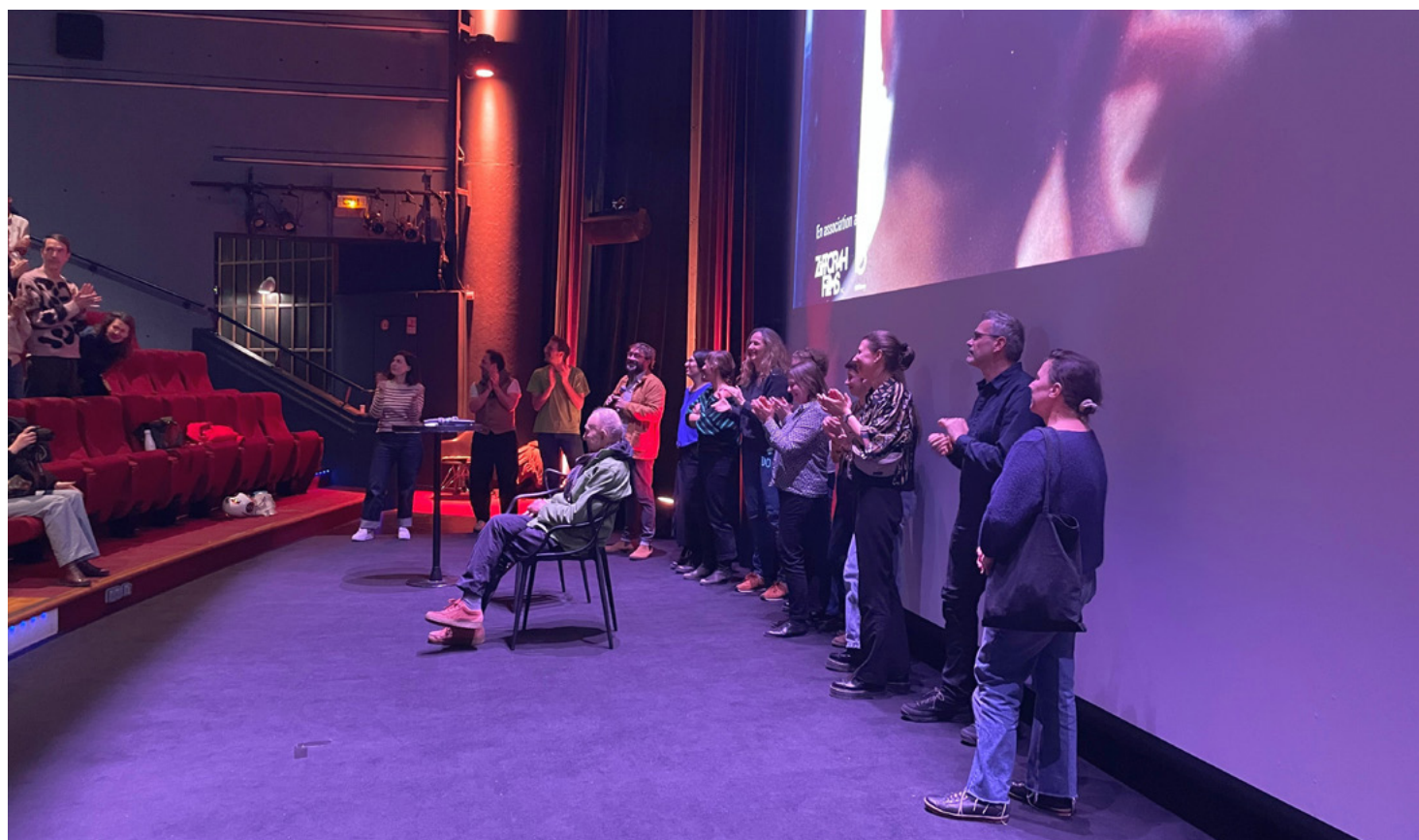
Projection de Public Housing le 19 mars 2025 au Forum des images

Par le cinéma, à travers le quotidien et les existences ordinaires, une des plus grandes comédies humaines s'est écrite, de Titicut Follies en 1967 à Menus-Plaisirs - Les Troisgros en 2023. « Nos humanités », tel était le sous-titre de la rétrospective. Nous souhaitions ainsi souligner l'ampleur de cette fresque dédiée aux êtres humains qui peuplent la quarantaine de lieux explorés par ses films : grandeur et petitesse, ressorts et défaites, grâce et pesanteur, élévation et impuissance. Il s'agit aussi d'un théâtre d'une extraordinaire et permanente inventivité – mouvements, mots, gestes, langage. Cette filmographie en forme d'encyclopédie de l'humain permet de cultiver le regard, l'esprit et la pensée. Par la fréquentation de cette somme impressionnante d'expériences, de connaissances, nous avons fait « nos humanités ». Son œuvre est désormais un legs précieux pour penser la complexité du monde.